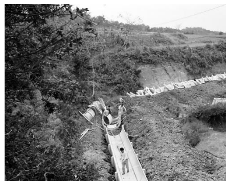
支線水路工事（昭和 35 年）