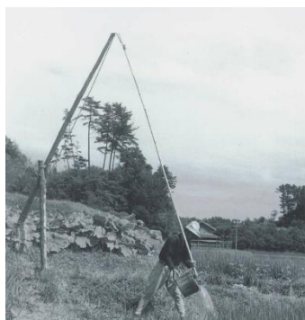
はねつるべによる取水