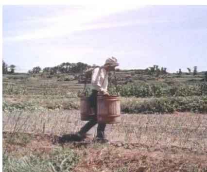
担い桶による水やり